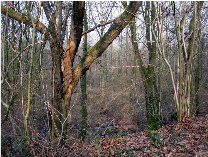
Wald auf der Nordseite des Bahndamms der Boxteler Bahn in Uedemerbruch (2011)