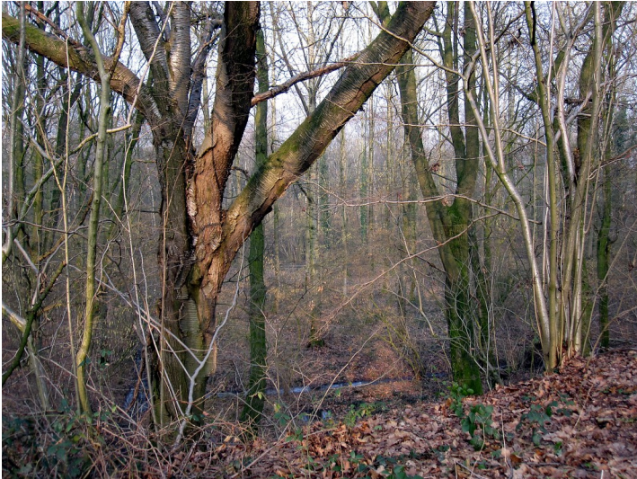
Wald auf der Nordseite des Bahndamms der Boxteler Bahn in Uedemerbruch (2011)