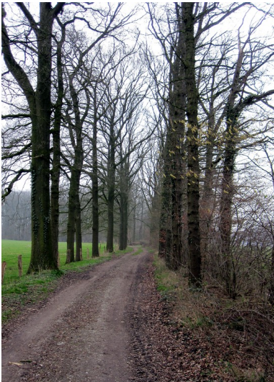
Von Bäumen gesäumter Weg (Allee) im Nordwesten des Uedemerbruch (2011)