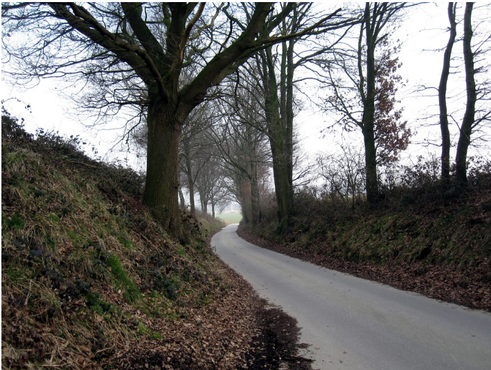
Straße "In der Loh" in Uedem in dem Abschnitt, in dem sie als Hohlweg ausgebildet ist (2011)