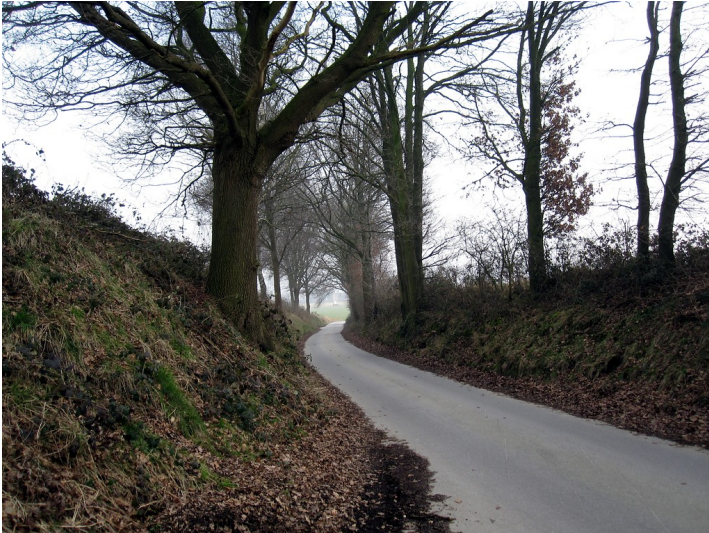
Straße "In der Loh" in Uedem in dem Abschnitt, in dem sie als Hohlweg ausgebildet ist (2011)