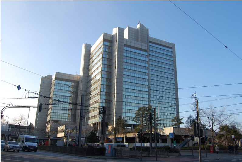
Neues Stadthaus am Berliner Platz (2012)