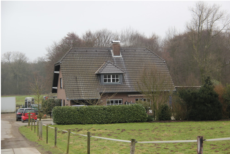
Mollenkath in Uedem-Uedemerfeld (2013)