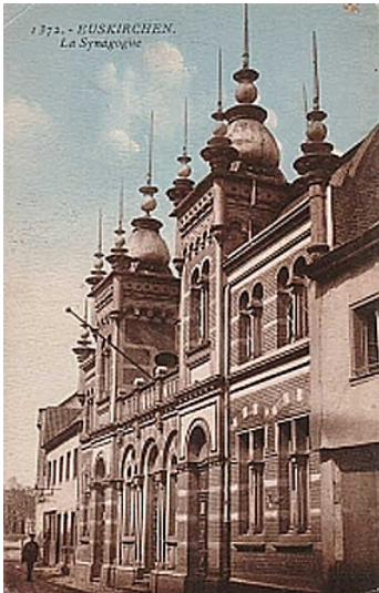
Historische Ansichtskarte aus der Zeit der Alliierten Rheinlandbesetzung (vor 1930) mit der Synagoge in Euskirchen.