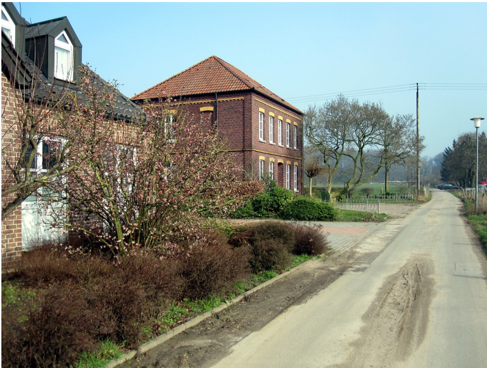
Bohnenstraße in Uedem-Uedemerbruch mit der angrenzenden Bebauung (2011)