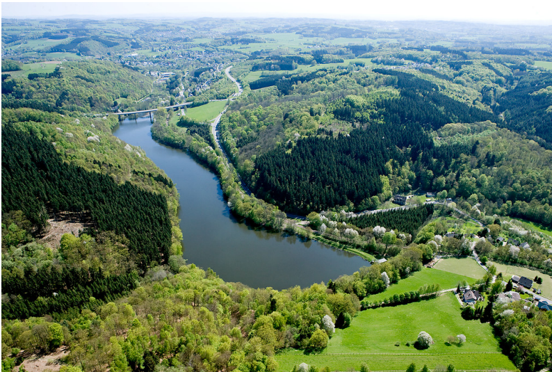
Luftbild des Biebersteiner Stausees, Wiehl (2009)