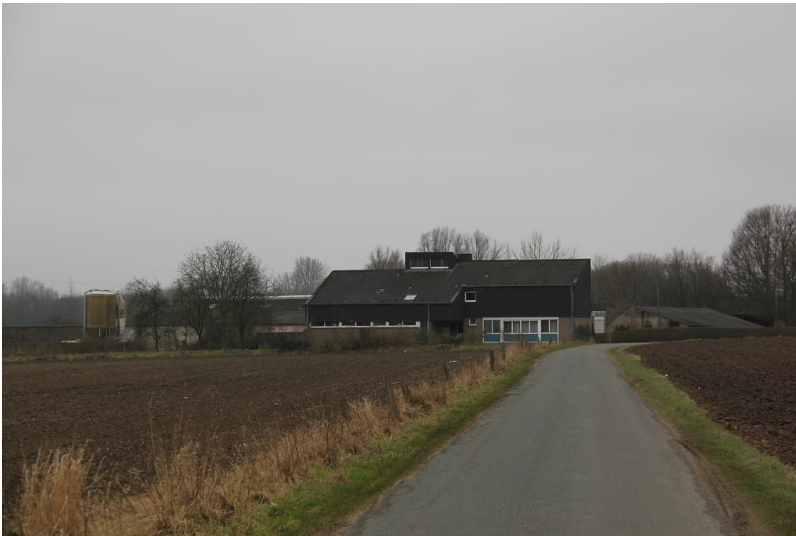
Gochfortzhof in Uedem-Uedemerfeld (2013)