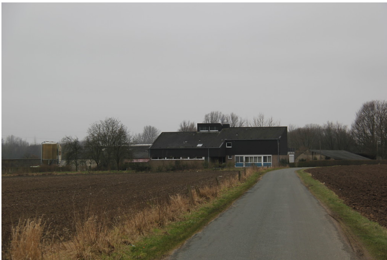
Gochfortzhof in Uedem-Uedemerfeld (2013)