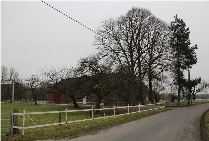
Der Klarenhof am Uedemerfelder Weg in Uedemerfeld (2013)