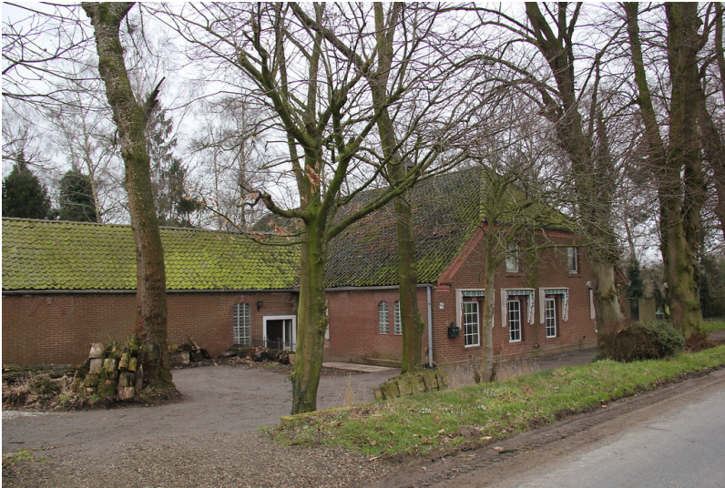
Beierhof in Uedemerfeld (2013).