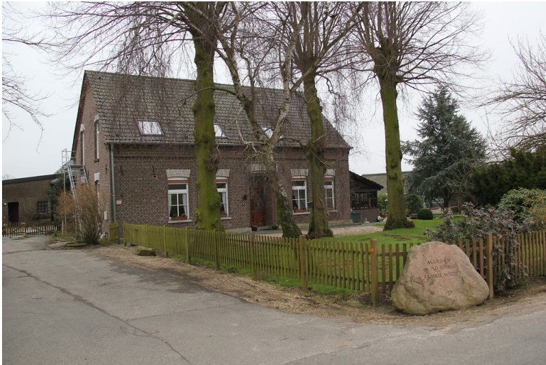
Wohnhaus des Maashofes in Uedem-Uedemerfeld (2013)