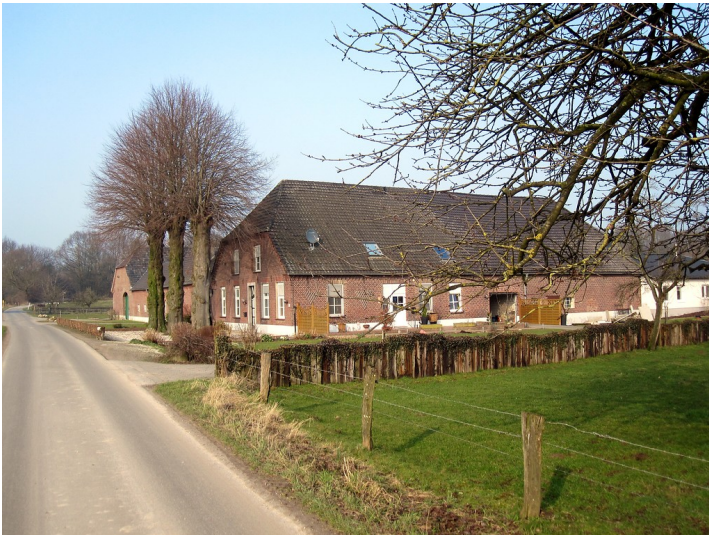
Rühlenhof in Uedemerfeld (2011)