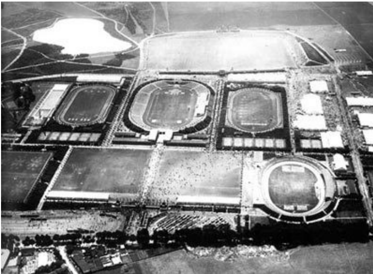
Historisches Luftbild des Sportpark Müngersdorf aus dem Jahr 1928