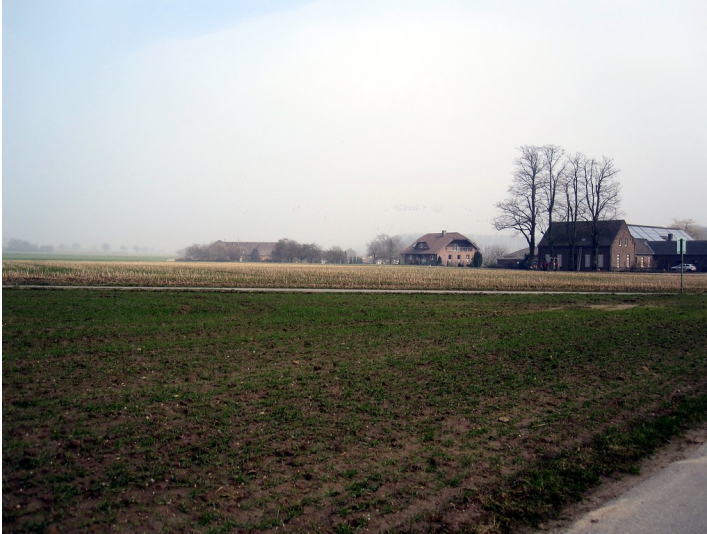
Scholtenhof in Uedem-Uedemerfeld umgeben von Landwirtschaftsflächen (2011)