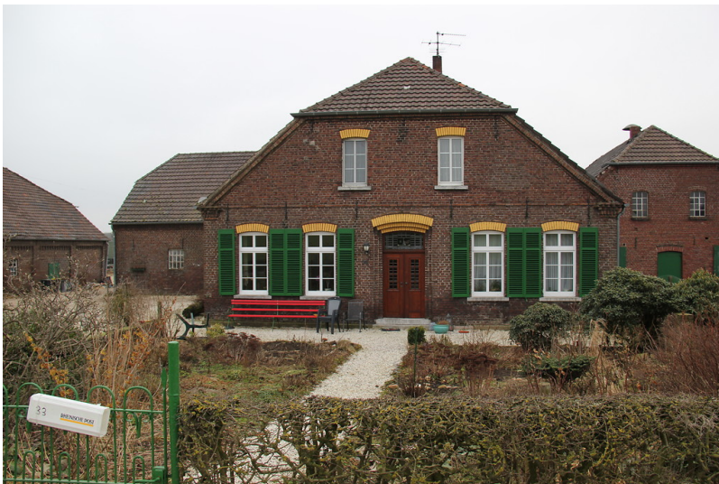
Wohnhaus des Haexhofes in Uedem-Uedemerfeld (2013)