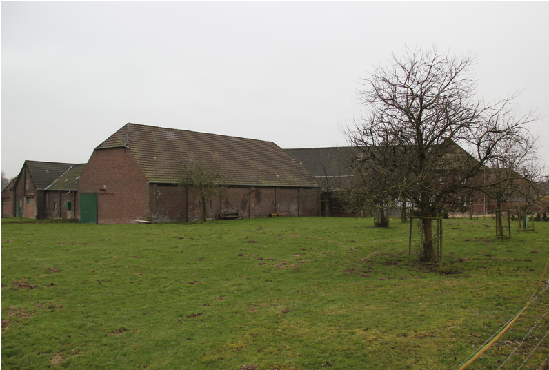
Grevenhof in Uedem-Uedemerfeld (2013)