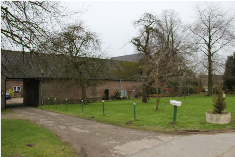
Lindenhof am Uedemerfelder Weg in Uedemerfeld (2013).