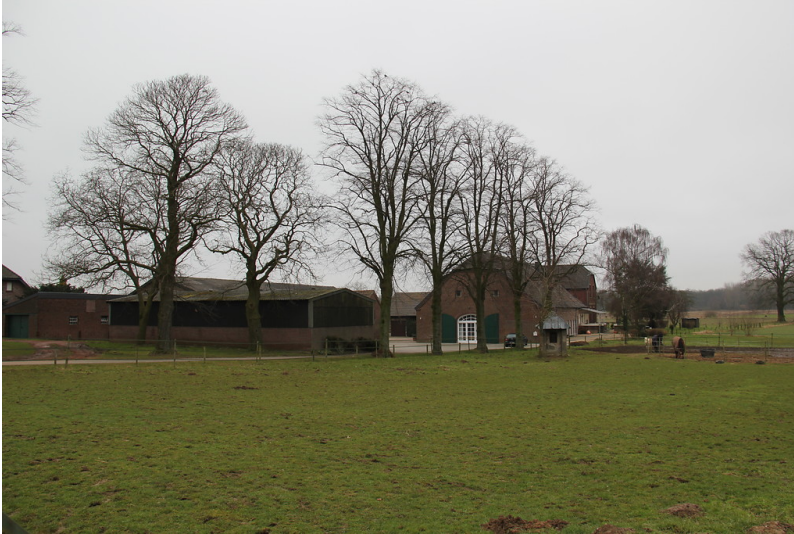
Mollenhof (Uedemerfelderweg 17) in Uedem (2013)