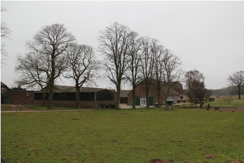
Mollenhof (Uedemerfelderweg 17) in Uedem (2013)