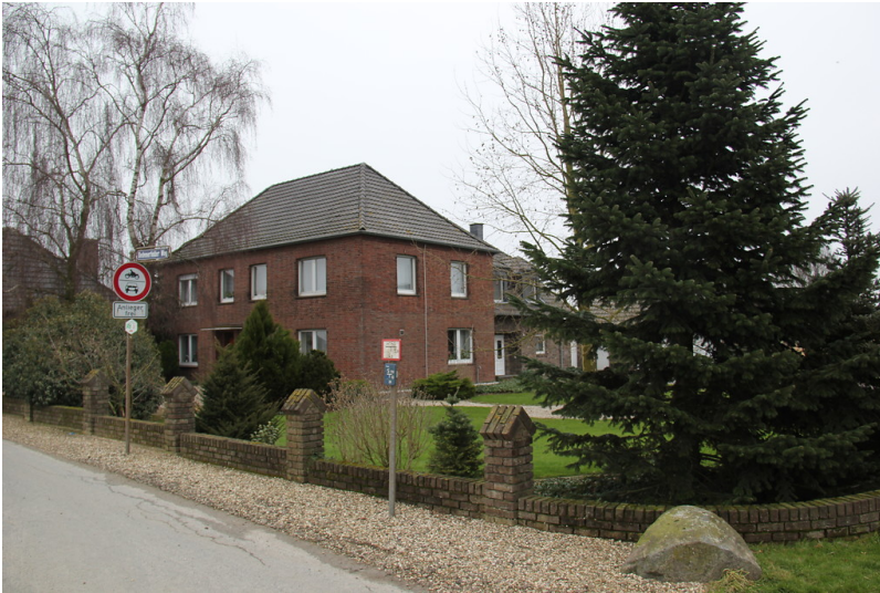
Wohnhaus des Riddershofs am Uedemerfelder Weg in Uedemerfeld (2013).