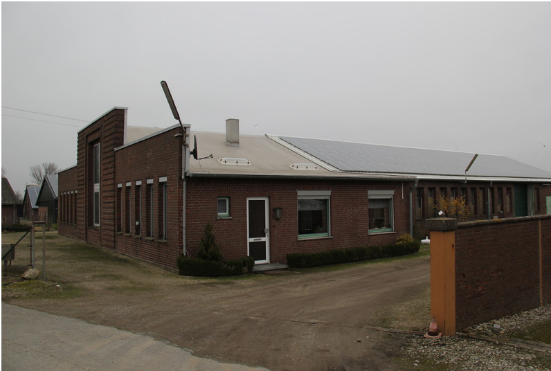
Böllgeshof am Uedemerfelder Weg in Uedemerfeld (2013).