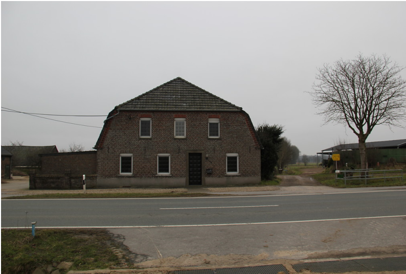
Wohnhaus des Berbeckshofs in Uedem-Uedemerfeld (2013)