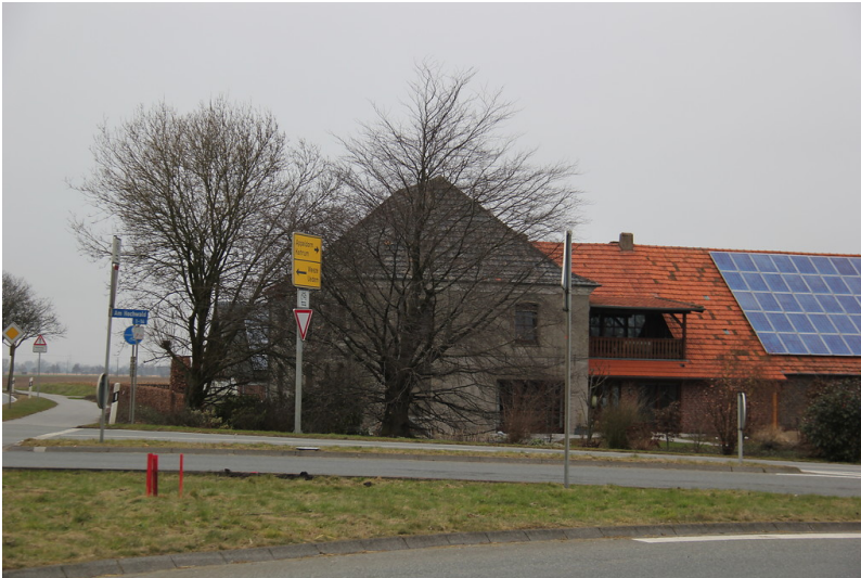
Der Delsenhof an der Uedemer Straße in Uedemerfeld (2013).