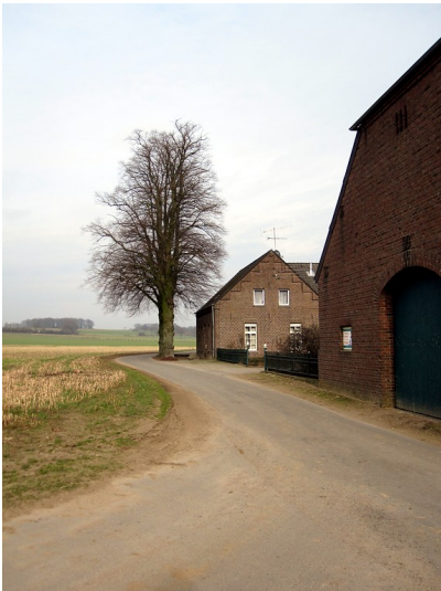
Der Scholtenhof, auch Willigen Hoff genannt, am Uedemerfelderweg in Uedemerfeld mit den beiden Linden vor dem Wohnhaus (2011).