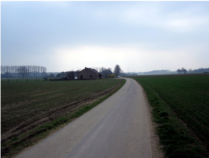
Uedemerfelder Weg (2011)