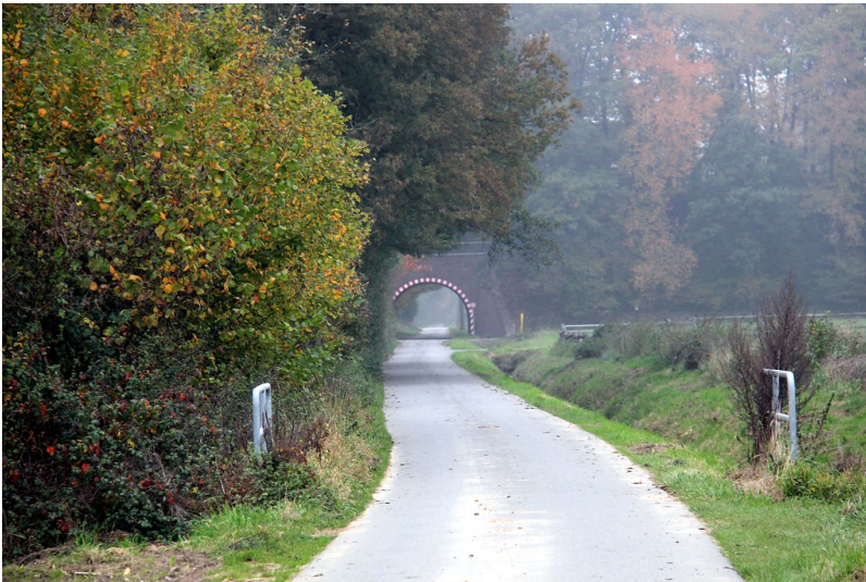
Die Holländische Straße in Uedemerbruch von Süden aus gesehen mit der Bahnunterführung und dem Bahndamm der Boxteler Bahn im Hintergrund (2012)