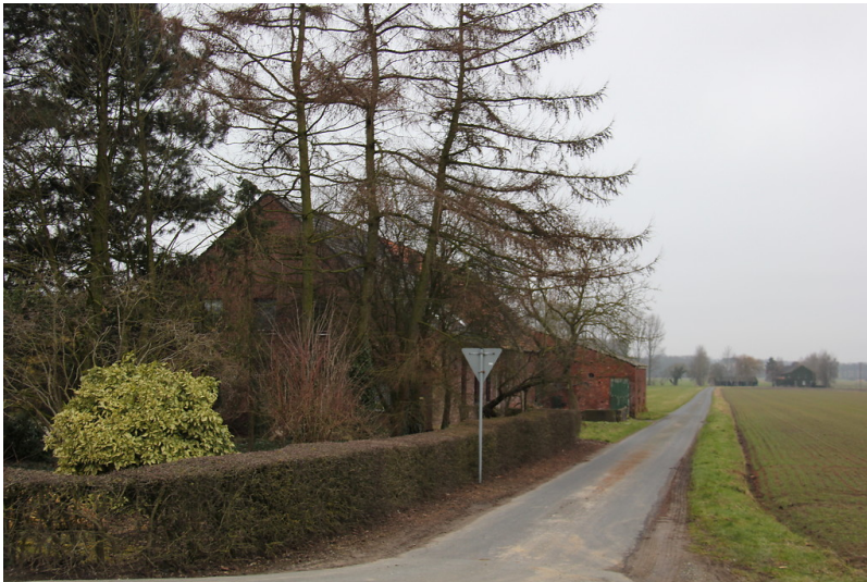
Östlicher Teil des Müserwegs in Uedem-Uedemerfeld mit Ackerflächen auf der rechten Seite des Wegs und dem Hof Müserweg 3 auf der linken Seite des Wegs (2013)