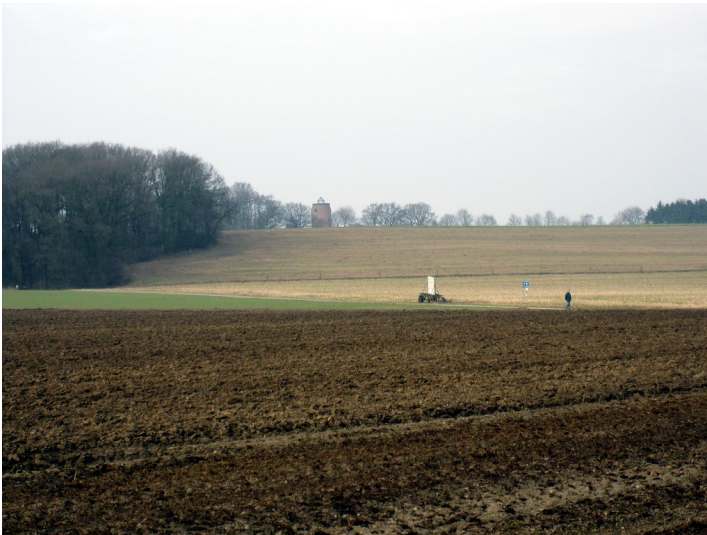
Eine Ackerfläche im Uedemerbruch (2011). Im Hintergrund ist die Hohe Mühle in Uedemerfeld zu erkennen.