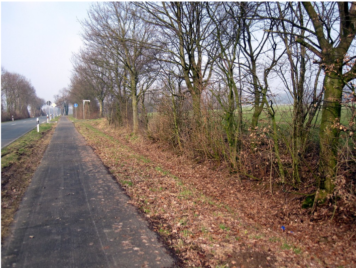
Uedemerbrucher Straße südlich von Uedemerbruch (2011)