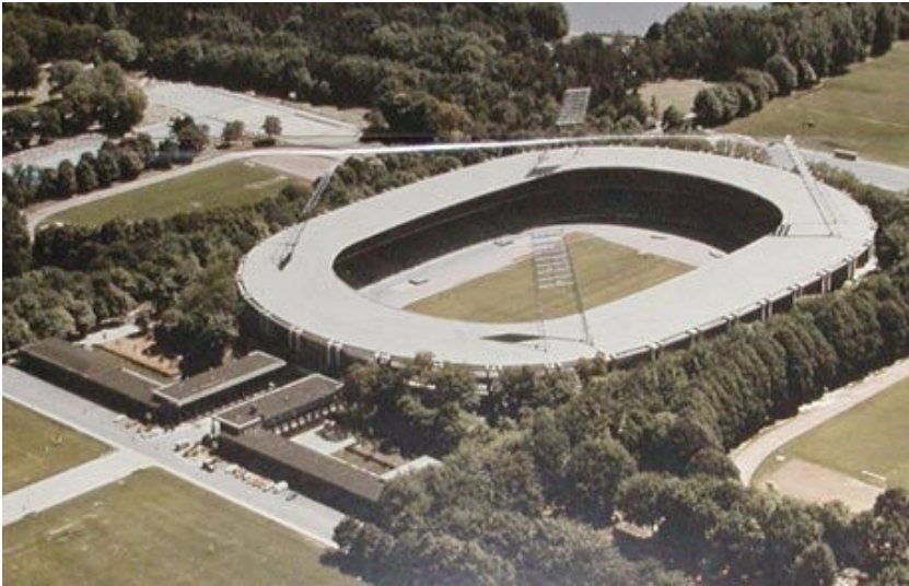
Das Müngersdorfer Stadion aus der Luft (zwischen 1975 und 2002)