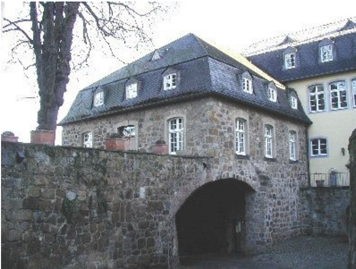
Torhaus der Abtei Sankt Michael