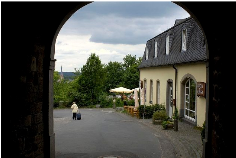
Vorburg der Abtei Sankt Michael