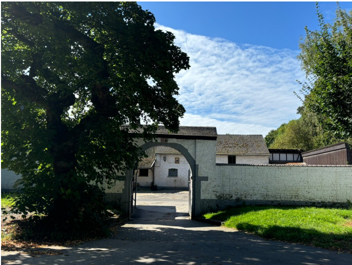
Hofeingang des Thurner Hofes in Dellbrück (2024)