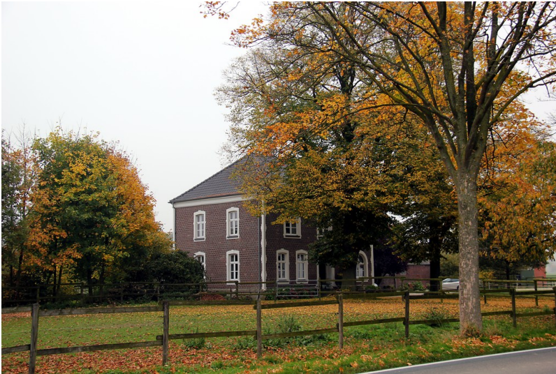
Das Wohnhaus des Bossenhofs in Uedemerbruch (2012).