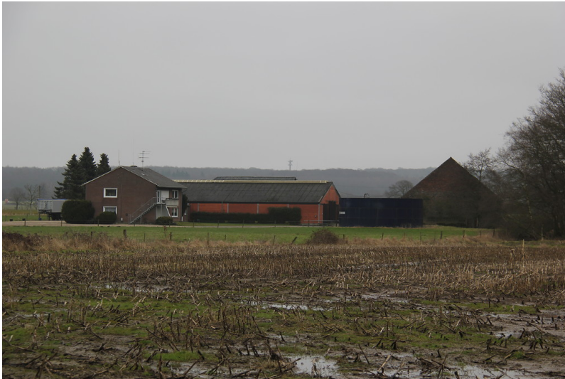
Lemmenhof in Uedem-Uedemerbruch (2013)