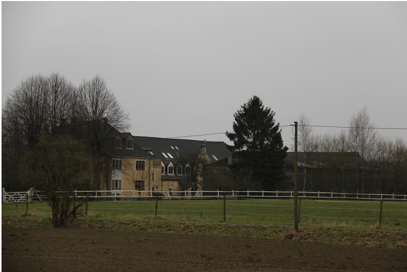
Hebbershof in Sonsbeck (2013)