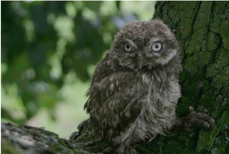
Ein junger Steinkauz, der in einer Astgabel eines Obstbaumes sitzt (2011).