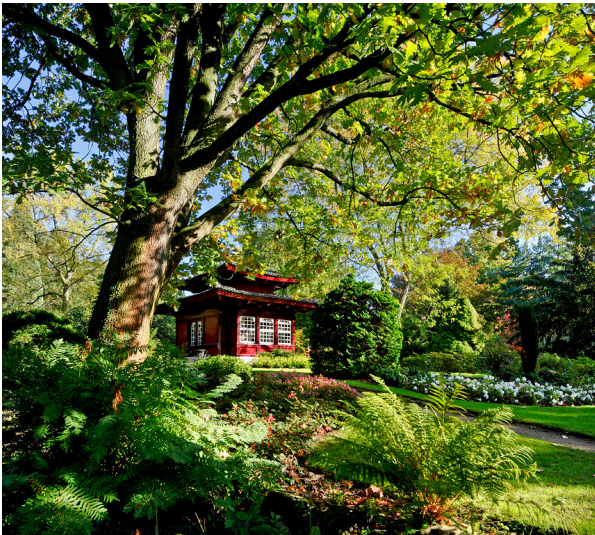
Japanischer Garten in Leverkusen (2009)