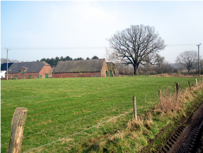
Albershof in Uedemerbruch (2011)