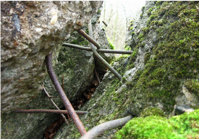
Stahlbetonreste in der Ruine des ehemaligen "Führerhauptquartiers Felsenest" bei Rodert (2012)