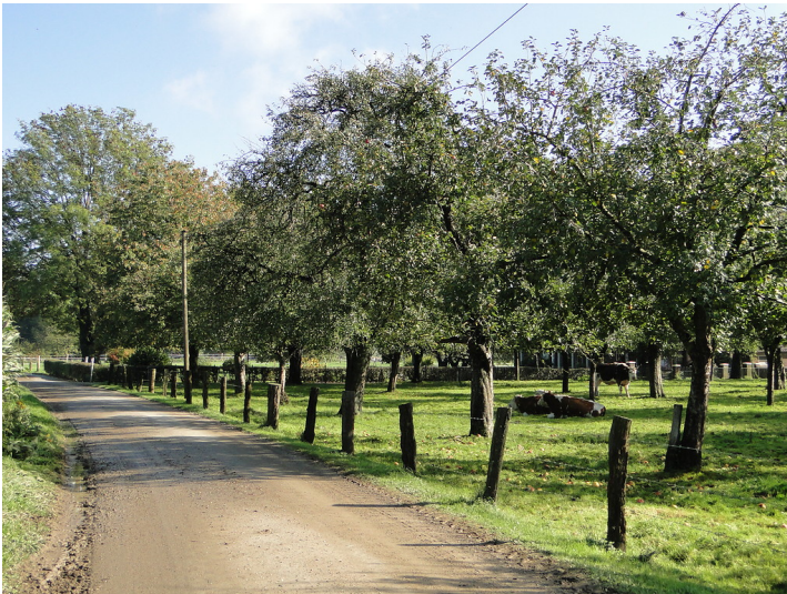
Beweidete Obstwiese im Uedemerbruch (2011)