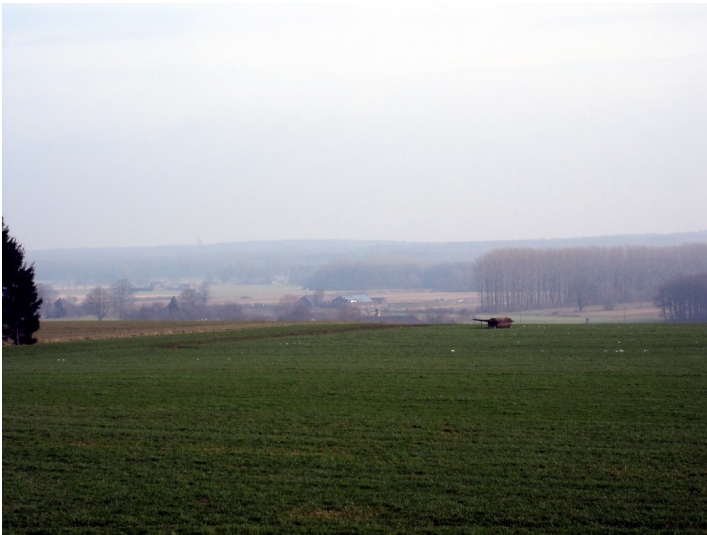
Blick von der Hohen Mühle in Uedem auf Uedemerfeld (2011)