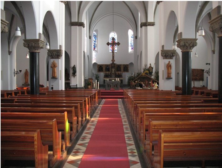
Innenraum der Pfarrkirche Sankt Arnold mit Blick auf den Altarraum (2012)