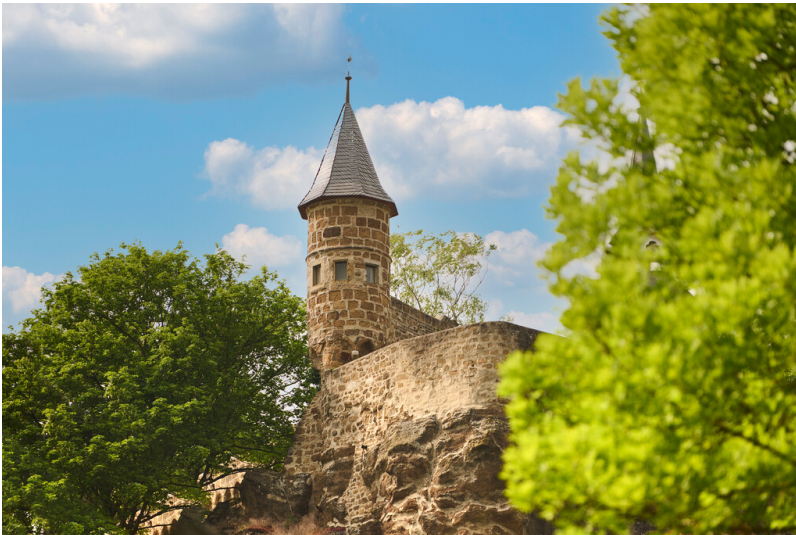
Ansicht des Johannistürmchens am Michaelsberg in Siegburg vom darunterliegenden Berghang (2023).