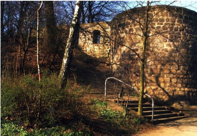
Der Hexenturm in Siegburg im Jahr 1998.