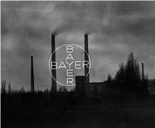
Das alte Bayer-Kreuz in Leverkusen zwischen den Kaminen des G-Kraftwerks (1933)