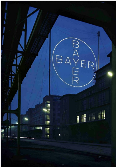
Das Bayer-Kreuz auf dem Dach des Farbenlagers, Gebäude B 9 im Jahr 1958.