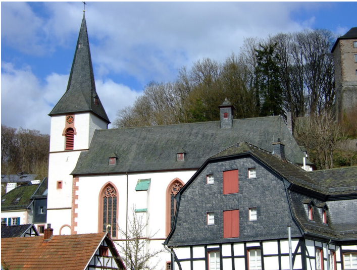
Südwestseite der Pfarrkirche Sankt Mariä Himmelfahrt in Blankenheim (Ahr) (2025).